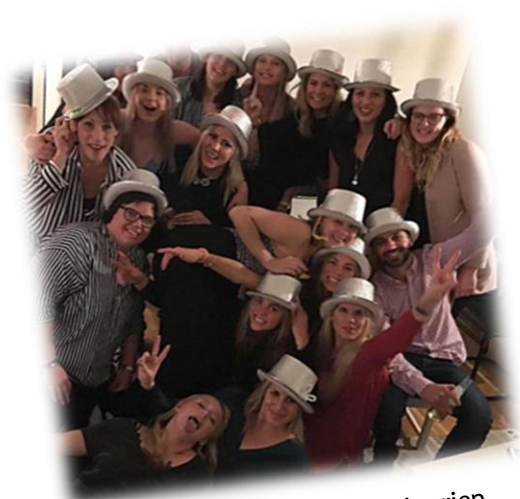
Laget firar sin andraplats i serien förra säsongen.

Första matchen spelas 22 april på "hemmaplan" (Idrottsparken, Timmele) och motståndet är Toarpsalliansen.