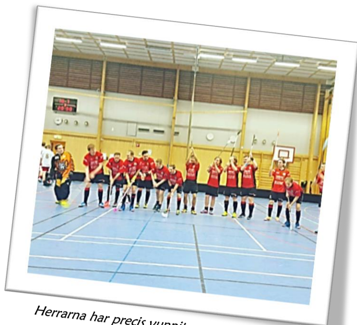
Herrarna har precis vunnit mot Nossebro IBK med 10-7 hemma i Södra Vinghallen.