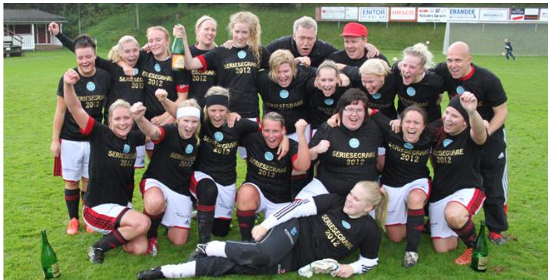
Södra Vings IF damlag seriesegrare