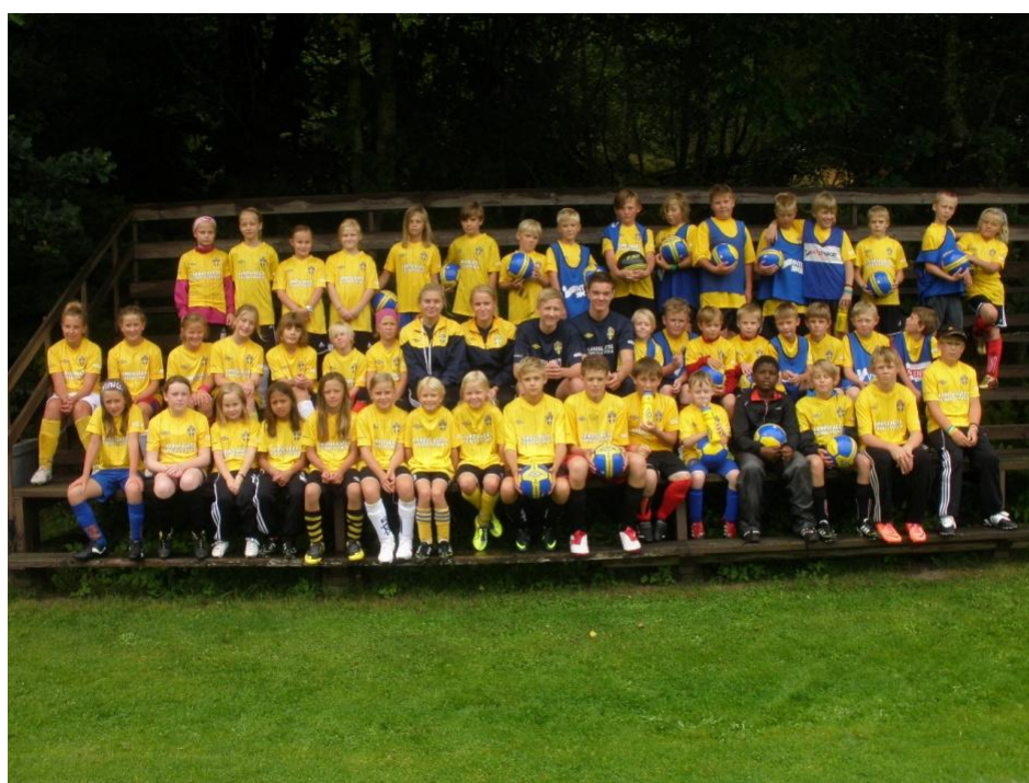
Hela gänget på Södra Vings IF första fotbollskola.